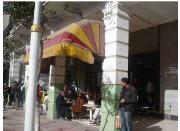
Photo2 : Les surveillants permanents de la rue.

« Parce que le dehors appartient à l'homme, que la réalité fait que la question n'est jamais posée pour l'homme, qu'il faut bien reconnaître que l'homme est celui qui est partout à sa place, c'est celui qui se déplace... » (Zineb Benzerfa Guerroudj, « les femmes algériennes dans l'espace public » Architecture et Comportement, volume 8, N°2, 1992, p, 128).