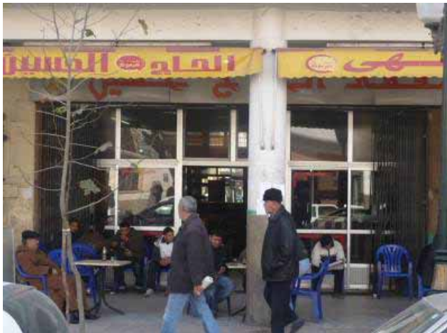
Photo1 : Le trottoir est utilisé comme terrasse de café.

Beaucoup d'installations établies sur les espaces piétons, les trottoirs, sont visiblement faits pour durer. C'est le cas par exemple des terrasses de cafés où les tables et les chaises qui les prolongent très en avant sur le trottoir, empêchant le piéton de circuler et l'obligeant à cohabiter avec la voiture sur la chaussée. Ceci est aussi l'une des causes majeures de l'absence de la femme dans ces espaces. En effet, le consommateur assis sur la terrasse d'un café n'a guère le sentiment d'être installé sur un espace public. Les tables et les chaises sont là pour témoigner d'une activité privée de type commercial installée sur des espaces affectés à la circulation piétonne.