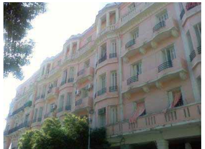
Photo 5 : Exemple de façade de la rue du 8 mai montrant que la plupart des persiennes sont fermées. Source :

Le rapport intérieur- extérieur s'exprime sous plusieurs aspects, l'un des aspects principaux est défini dans cette forme d'introversion exprimée au niveau des façades, qui malgré, le grand nombre d'ouvertures qu'elles comportent, des fenêtres, des portes fenêtres avec balcon, parfois même donnant sur de grandes terrasses, nous procure la sensation d'espaces non habités, aucune forme d'appropriation ou de présence d'usagers ne se manifeste sur les façades, aucune présence sur les balcons ou les terrasses, trop exposés aux regards, ils ne favorisent pas d'utilisation. Les balcons qui sont le symbole d'une prise de pouvoir dans les anciennes sociétés occidentales, et dont la seule fonction est l'exposition s'opposent à nos valeurs. Les seules fenêtres ouvertes sont celles des habitations transformées en bureaux et occupées par des professions libérales comme les avocats, les médecins, les notaires etc...les persiennes sont toujours fermées, malgré les voilages intérieurs qui empêchent toute relation visuelle avec l'extérieur. Dans certains cas des bâches sont accrochées sur les fenêtres pour accentuer plus la séparation.