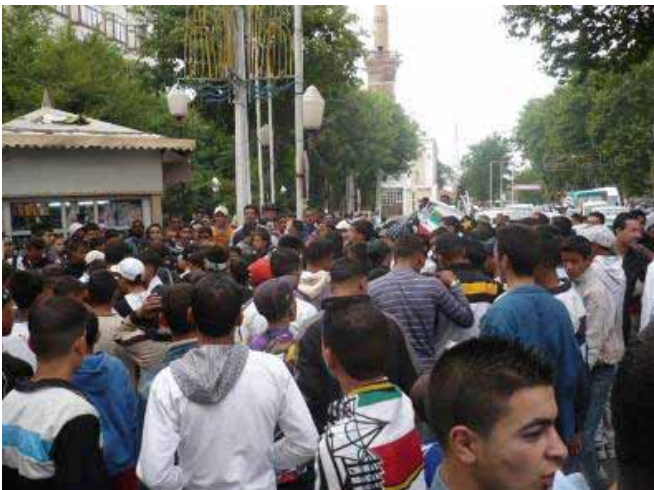
Photo 4 : Dans le cas d'activités exceptionnelles la rue devient exclusivement le territoire des hommes.

« Les arabes devraient sans doute avoir à l'égard du corps et des ses droits un ensemble de conceptions implicites totalement différentes des nôtres. Effectivement, leur goût de se bousculer et de se presser en public, leur façon de pincer, et de tâter les femmes dans les transports publics ne seraient tolérées par les occidentaux. Je supposai qu'il n'avait pas l'idée de l'existence d'une zone personnelle privée à l'extérieur de leur corps, et mes recherches le confirment. » (Edward T. Hall, « la dimension cachée », éditions du seuil, 1971, p, 193)