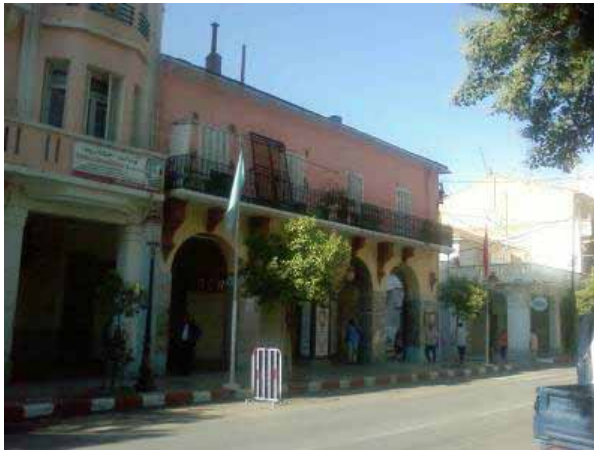
Photo 6 : Vue sur la rue du 8 mai, le balcon restant des espaces extérieurs.

La façade a tendance à devenir une paroi opaque, imperméable à toute relation avec cet extérieur, un extérieur inconnu, hostile voire chaotique dont on doit se protéger, dont on doit protéger la femme, la recherche d'une introversion exprimée par des accessoires montés sur les façades (les bâches, les panneaux métalliques disposés à hauteur de la vue afin de briser les regards de part et d'autre) ceci n'est une forme d'adaptation à une typologie donnée. « l'espace social se définirait-il par la projection d'une idéologie dans un espace neutre. ( Henri Lefebvre, « la production de l'espace », éditions Anthropos, 1974, p, 242) Dans la culture arabe, la préservation de l'intimité est étroitement liée à la place de la femme dans la société. La femme joue le rôle d'acteur principal générateur de l'intimité. La femme nécessite d'être protégée des regards des gens de la rue, ce concept se trouve concrétisé dans la conception même des espaces.