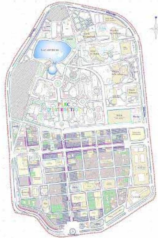
Figure 1 : POS du centre ville de Sétif avec la rue du 8 mai comme axe structurant le centre ville.

l'origine des effets de longues perspectives sur la rue et contribue à générer d'une grande part les champs de rencontre. La morphologie du site présentant une déclivité ouest-est et accentue cette relation.