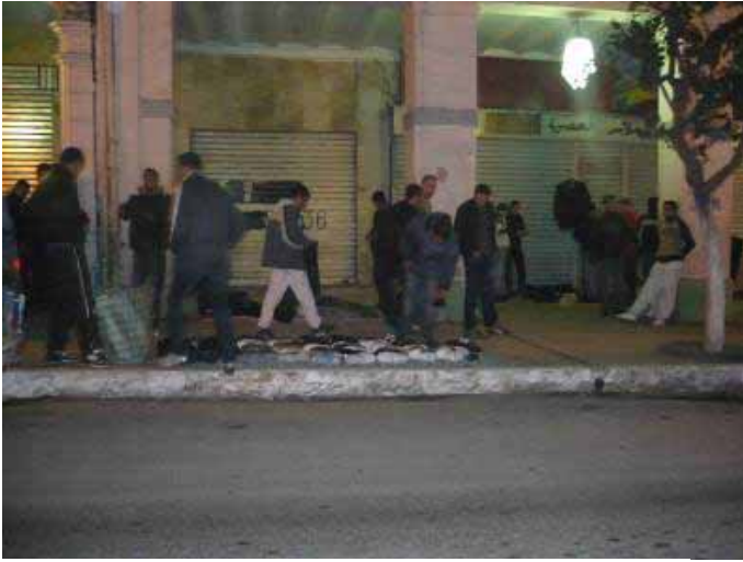
Photo 3 : Le trottoir squatté par les jeunes chômeurs avec leur marchandise l'après midi jusqu'au soir.

Pour les activités exceptionnelles telles que les fêtes, les parades, les défilés, bien que l'espace de la rue devienne une scène publique, la femme en tant qu'individu différencié socialement, ne peut accepter de se mettre en danger dans des espaces qui sont support de tous types de comportements sociaux.