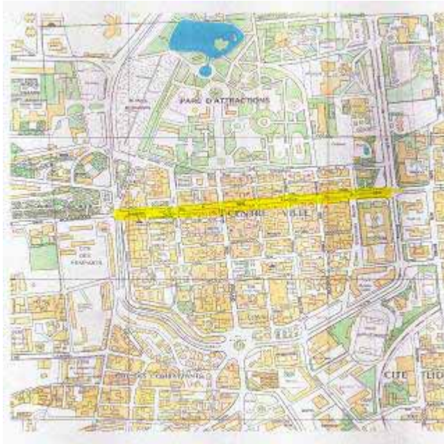
Figure 2 : Plan du centre ville : la rue du 8 mai, axe générateur du tracé dans le centre historique.

Beaucoup d'installations établies sur les espaces piétons, les trottoirs, sont visiblement faits pour durer. C'est le cas par exemple des terrasses de cafés où les tables et les chaises qui les prolongent très en avant sur le trottoir, empêchant le piéton de circuler et l'obligeant à cohabiter avec la voiture sur la chaussée. Ceci est aussi l'une des causes majeures de l'absence de la femme dans ces espaces. En effet, le consommateur assis sur la terrasse d'un café n'a guère le sentiment d'être installé sur un espace public. Les tables et les chaises sont là pour témoigner d'une activité privée de type commercial installée sur des espaces affectés à la circulation piétonne.