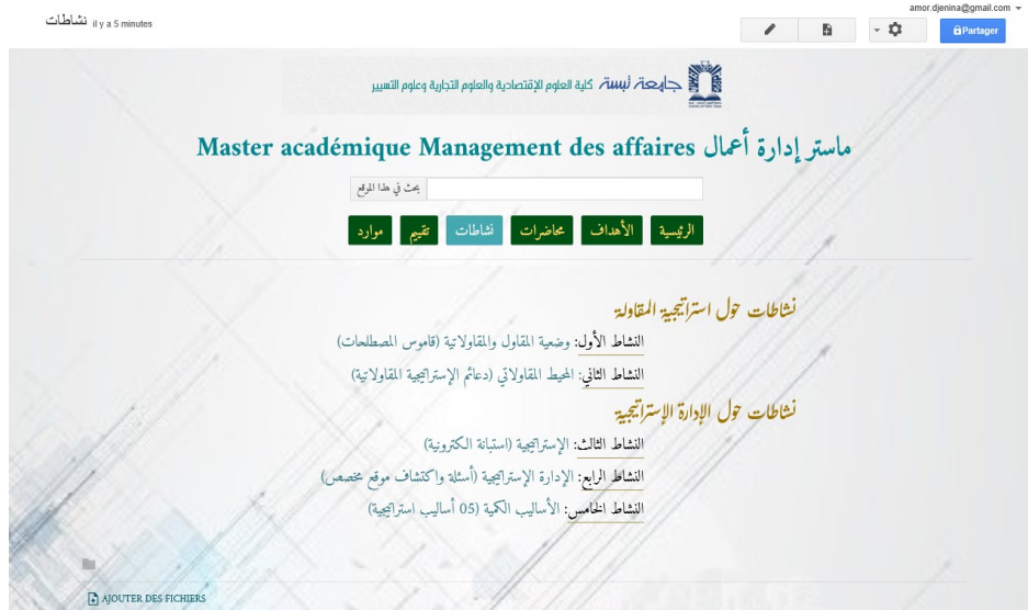
Figure (4) : Passage aux activités par le lien hypertexte

PLAN : Une contribution pratique visant à améliorer l'enseignement dans le supérieur Cas du Master académique « Management des affaires» à la FSESCSG, Université de Tébessa.