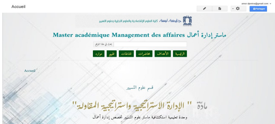
Figure (2) : Page d'accueil du site de formation